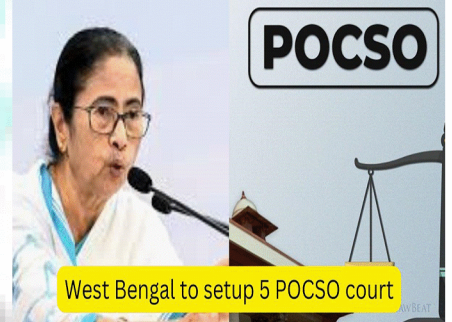
West Bengal to setup 5 POCSO court

(B) हाल ही में पश्चिम बंगाल सरकार ने पश्चिम बंगाल में पांच नए POCSO फास्ट ट्रैक विशेष न्यायालय स्थापित करने का निर्णय लिया है। राज्य में पहले से ही छह ई POCSO न्यायालयों के अलावा 62 POCSO न्यायालय है। यौन अपराधों से बच्चों का संरक्षण अधिनियम 2012 POCSO बच्चों के खिलाफ यौन अपराधों में त्वरित न्याय सुनिश्चित करता है।